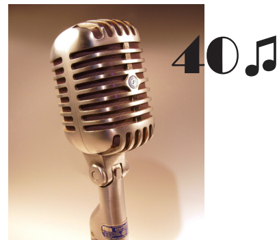
Von Holger.Ellgaard - Eigenes Werk

Li van cantar les quaranta. T'ho he dit mil vegades. Només han caigut quatre gotes. Anava de vint-i-un botó. És com començar de zero. Això ja sembla can seixanta. S'espatlla cada dos per tres. Hem de tocar el dos!